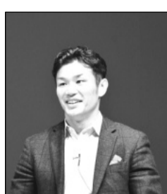
活躍する場を作る

また、南足柄市立岩原小学校PTAからは、会員数の減少の問題に向き合い、役員定数の見直しや、保護者や地域のボランティアで、活動を支えている事が報告されました。