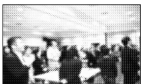
みんなと触れ合って

いじめがどういうものか、どうやって発展していくのかを学ぶことができました。委員長はみんなより少し仕事が多かったのですが、皆さんの反応や意見を聞くことができました。今後、ここで学んだことを生かせる