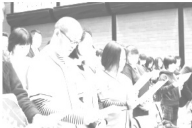
お揃いのTシャツを着て

防犯・防災マップは、グループマップの機能を活用し、子ども110番の家や危険箇所の視認性を高めています。