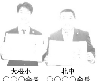
大根小 〇〇〇〇会長 北中 〇〇〇〇会長

平塚市浜岳中学校PTAは役員の成り手不足解消のため、役員の負担軽減に取り組みしています。また平塚市P連と共に、市全体で個人情報を取り扱いを検討していることを報告しました。