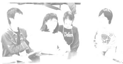
コミュニケーションの大切さを話し合う

平成30年度「いじめを考える児童生徒委員会」の第4回(全4回)が行われ、小中学校の代表に教職員・保護者・地域の方も加わり、150人が一堂に集いました。今年度は、いじめの未然予防と根絶に向けた「はだのつ