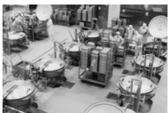
こんな施設が秦野にもできる?