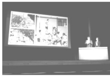
多彩な活動がある大根中

「砂田が丘祭」には、PTAのバザーや各部活動による模擬店が出店されます。各部の売り上げはそれぞれの部活動費に